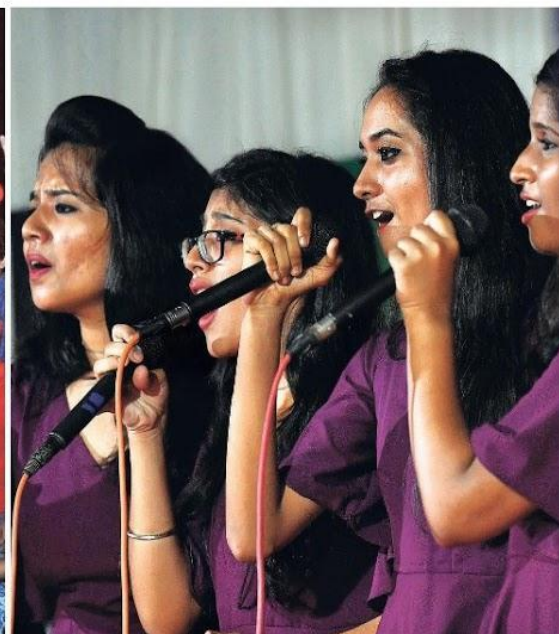
Celebration time: Students of Sacred Heart College, Thevara, are jubilant after they lifted the overall championship at the Mahatma Gandhi University Arts Festival that concluded in the city on Tuesday; and (right) students take part in the western group song event.