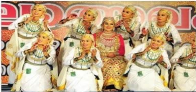
Students of Sacred Heart College, Thervara, celebrate after clinching the championship in the MG University Art Fest in Kochi on Tuesday.(R) The Oppana team of RLV College, Tripunithura, which won the first prize in the fest

IR T @ Kochi Heart College, Thervara, caused a major upset by winning the MG University Youth Festival -ASANTHAM 2018 by dethroning St Teresa's College, Ernakulam, which had won the overall championship seven times back to back.