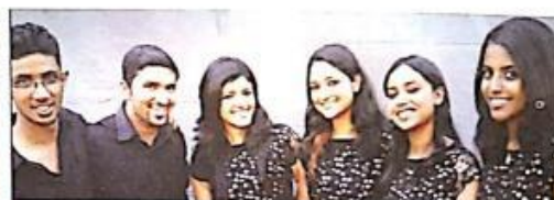
Group Western- Third Prize