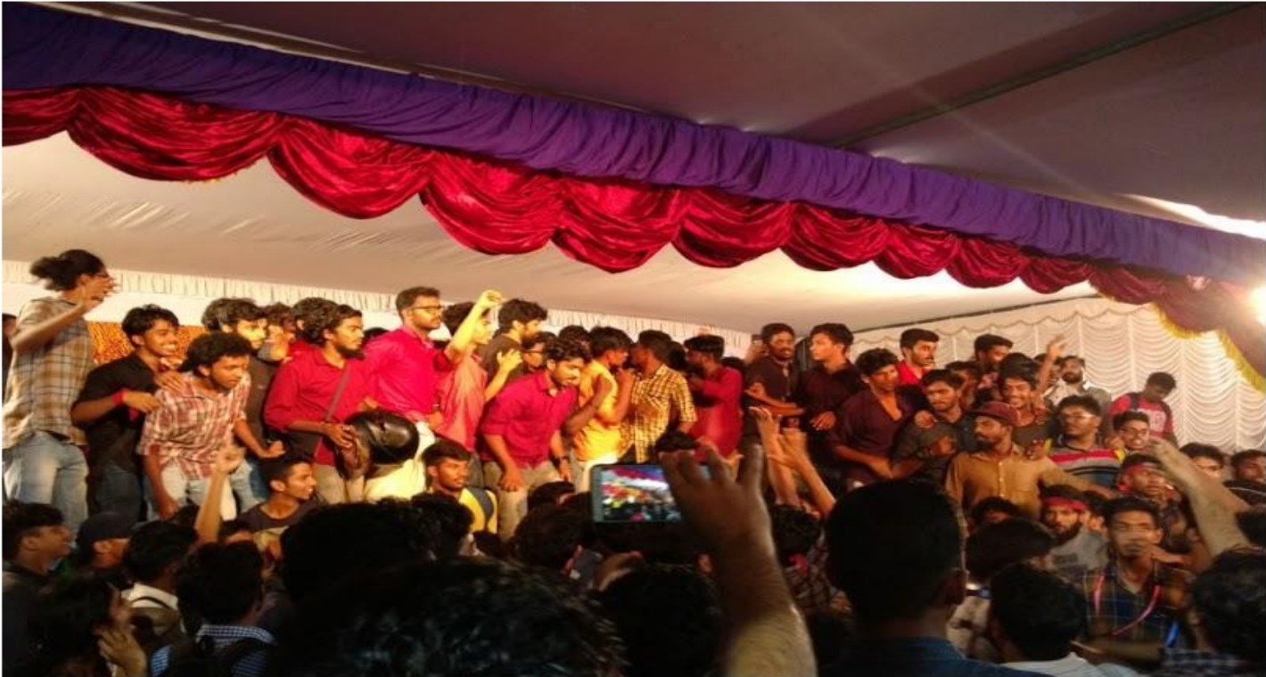
MG UNIVERSITY YOUTH FESTIVAL