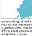
കോട്ടയം എംജി സർവകലാശാലാ കലോത്സവത്തിൽ ആഘോഷിച്ചു. ചുരങ്ങോട്ടം ചേർത്തി തേവര എസ്എച്ച്എംജി സർവകലാശാലാ കലോത്സവത്തിൽ ആഘോഷിച്ചു.