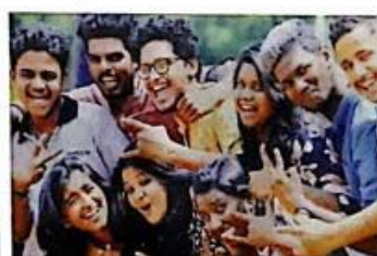
Skit- First prize