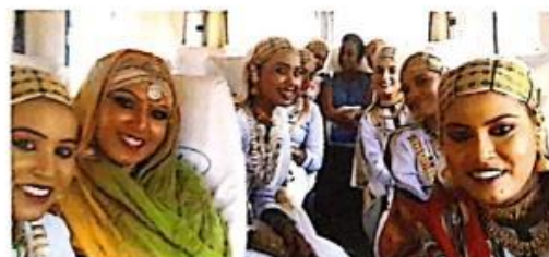
Oppana- Third Prize