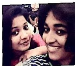
Inter-University National Youth Festival 2015