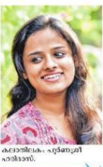
കലാകർമ്മം പൂർണ്ണശ്രീ കാഴ്ചവെച്ചു.

കോട്ടയം • തിരുക്കടവോളം പൂർണ്ണശ്രീ കലാകർമ്മം നേടിയ തേവര എസ്എച്ച്എംജി സർവകലാശാലാ കലോത്സവത്തിൽ ആഘോഷിച്ചു. ചുരങ്ങോട്ടം ചേർത്തി തേവര എസ്എച്ച്എംജി സർവകലാശാലാ കലോത്സവത്തിൽ ആഘോഷിച്ചു. ചുരങ്ങോട്ടം ചേർത്തി തേവര എസ്എച്ച്എംജി സർവകലാശാലാ കലോത്സവത്തിൽ ആഘോഷിച്ചു.