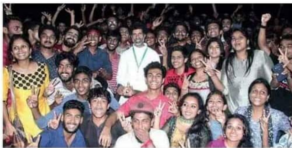
Students of Sacred Heart College, Thevara, celebrate after clinching the championship in the MG University Art Fest in Kochi on Tuesday. (

Updated: 14th March 2018 05:35 AM | A+ A A-