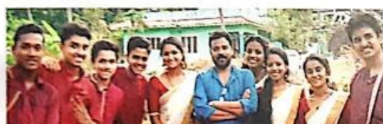
Group song Indian- First Prize