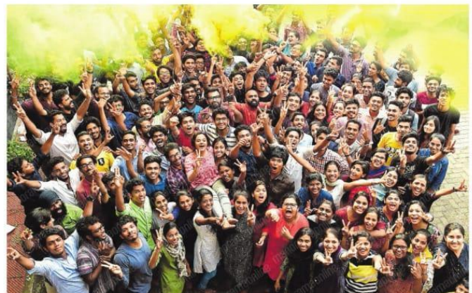
തിലകച്ചാർത്തിയിൽ... എംജി സർവകലാശാലാ കലോത്സവത്തിൽ, നേടിയ തേവര എസ്എച്ച്എംജി കലാകർമ്മം എസ്എച്ച് എംജി സർവകലാശാലാ കലോത്സവത്തിൽ ആഘോഷിച്ചു. ചുരങ്ങോട്ടം ചേർത്തി തേവര എസ്എച്ച്എംജി സർവകലാശാലാ കലോത്സവത്തിൽ ആഘോഷിച്ചു.

കോട്ടയം • ചരിത്രത്തെ വിദ്യുത്തികയച്ചുനി കലിത്തവർഷം നേടിയ കലാകർമ്മം ഇങ്ങനെ ആയി. നാളെയാണ് ചുരങ്ങോട്ടം ചേർത്തി തേവര എസ്എച്ച്എംജി സർവകലാശാലാ കലോത്സവത്തിൽ 118 പൊതുവിദ്യാർത്ഥികൾ വിജയം ആഘോഷിച്ചിട്ടു തന്നെ സമുച്ചിത താരാഭാരി മേനിയെ പൂർണ്ണശക്തി കാഴ്ച വെച്ചു കൊണ്ടിരിക്കുകയാണ്. അദ്ധ്യക്ഷതയ്ക്കായി ഡോ. സി.എസ്.എസ്. 106 പൊതുവിദ്യാർത്ഥികൾ 62 പൊതുവിദ്യാർത്ഥികൾ ചേർന്നു. പ്രതികൂല കാലാവസ്ഥയ്ക്കെതിരെ സാധാരണക്കാർക്ക് താല്പര്യം ഉണ്ടെന്ന് എന്തിനാണ് പരീക്ഷിക്കുക.